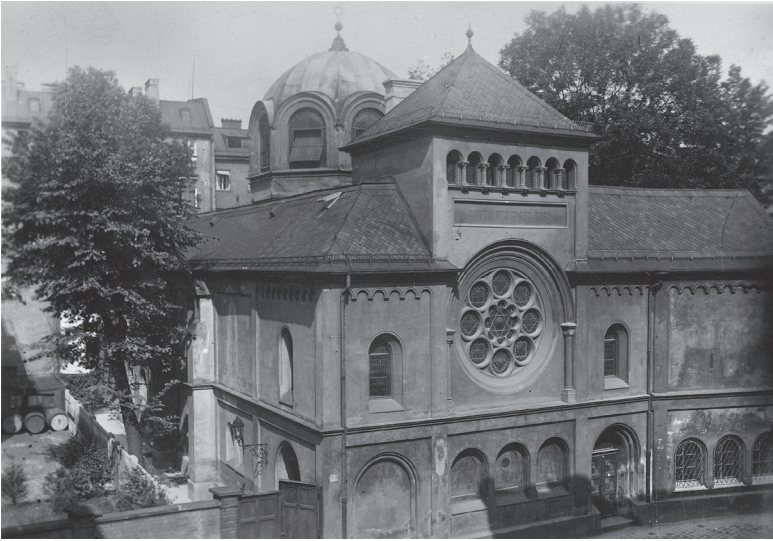
Die mit der orthodoxen Synagoge verbaute Volksschule in der Herzog-Rudolf-Straße in der Münchner Altstadt: Das Schulgebäude ist der Anbau auf der rechten Seite.

der an öffentlichen oder privaten Volksschulen. Während sich die Schülerzahlen an der Jüdischen Schule in den Jahren vor 1933 stabil bei etwa 110 bis 120 Kindern eingependelt hatten, wurden für das Schuljahr 1934/35 bereits 256 Schülerinnen und Schüler registriert; 7 aus ganz München strömten nun morgens die Kinder in die Herzog-Rudolf-Straße, die einen zu Fuß, die anderen zumindest zum Teil mit der Straßenbahn, da die Wege so lang waren.